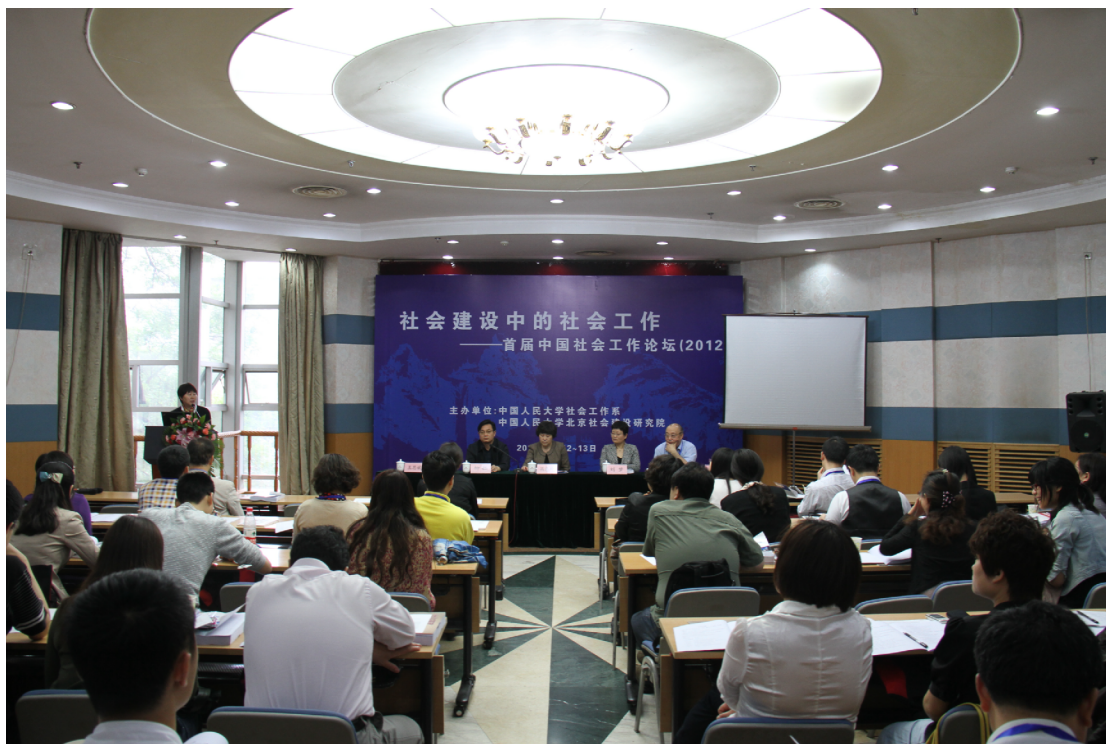
5月12日至13日,“社会建设中的社会工作”首届中国社会工作论坛在中国人民大学逸夫会议中心隆重召开。图为论坛开幕式现场。

2012年5月25日 星期五 本期4版 总第41期 主办:共青团中国人民大学社会与人口学院委员会 团宣准字:09-0205号 指导老师:唐颖 监制:张浣璐 李龙 主编:翁美艺 本期执编:刘华章