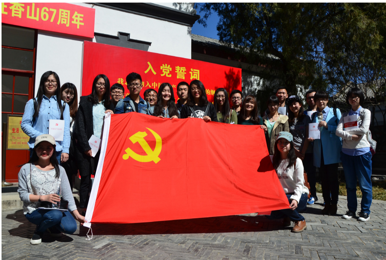
“瞻双清别墅，忆领袖指导”主题党日活动开展