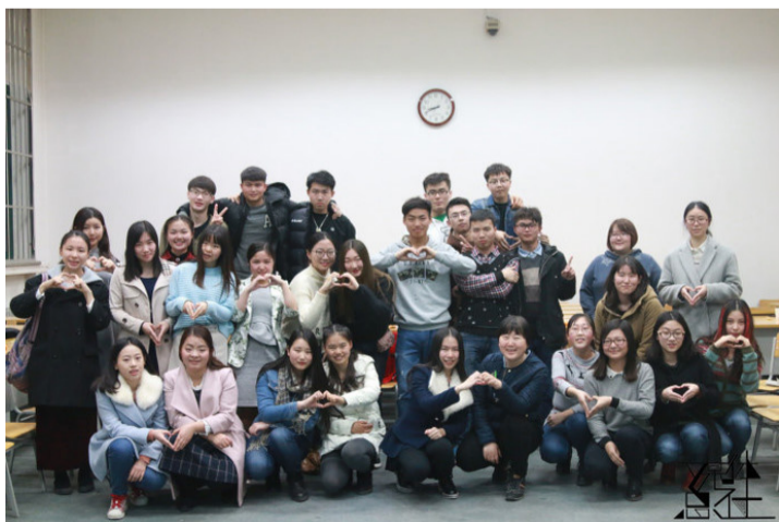
2014级社会工作系欢迎会顺利举行