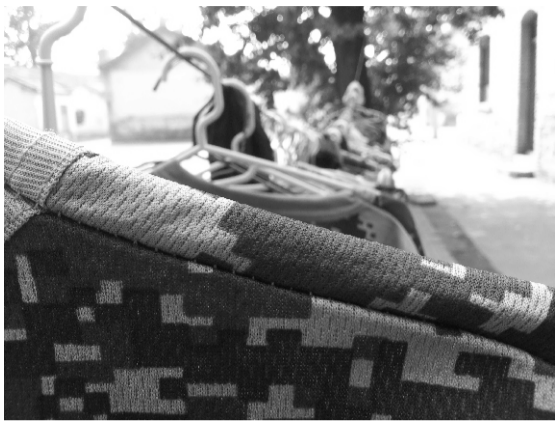
晾衣绳上一排的迷彩半截袖，男生也是很爱干净滴。