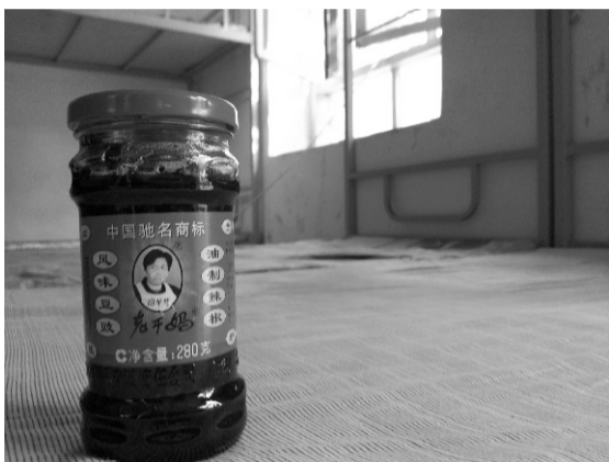
有了老干妈，从此吃饭不用怕！