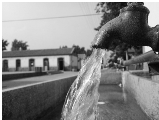
冰凉的自来水，冲走上午的燥热。