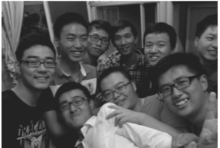
图为朋辈见面会——男生篇