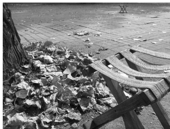
没有比坐在马扎上唠嗑更幸福的事。