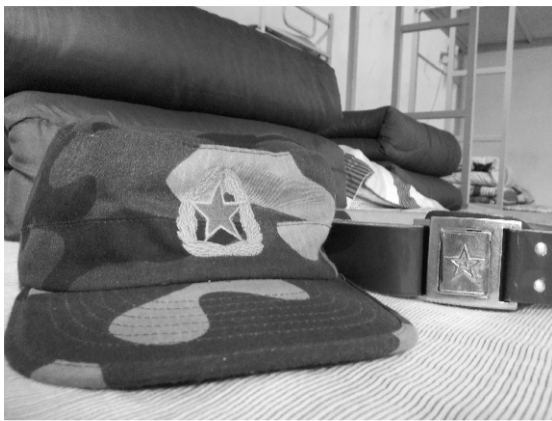
军训第一天，军帽、腰带，豆腐块儿，一样都不能少！