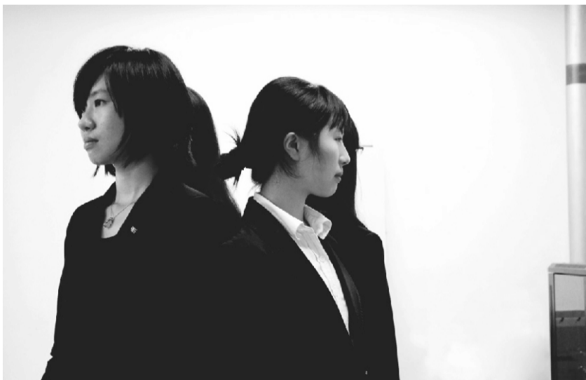
图为媒体总社的招新视频预告

尾语：据悉，一共314名新生（其中85名在苏州校区）加入社会与人口学院大家庭。由13级本科生91名、研究生177名、博士生35名组成的成荫新绿正要为社会与人口学院的调色盘调和出更夺目的色彩，期待他们呈给大学生活一幅属于自己的最完美的画卷！