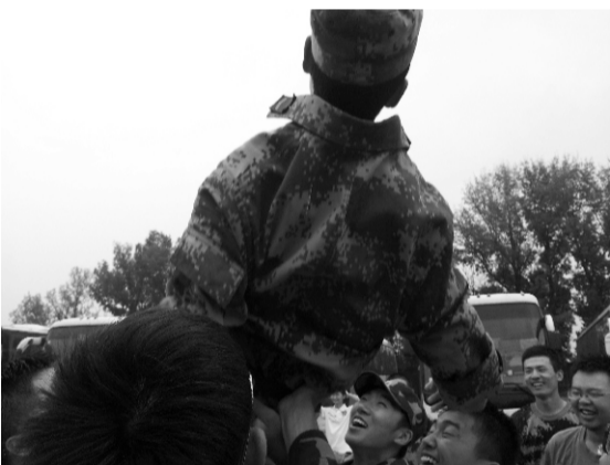
离别是为了更好的相聚。教官，我们舍不得你。