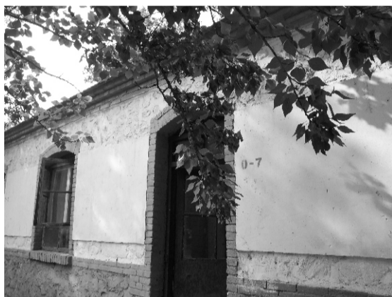
翠叶掩映，树影斑驳，静静的院落里是我们的宿舍。