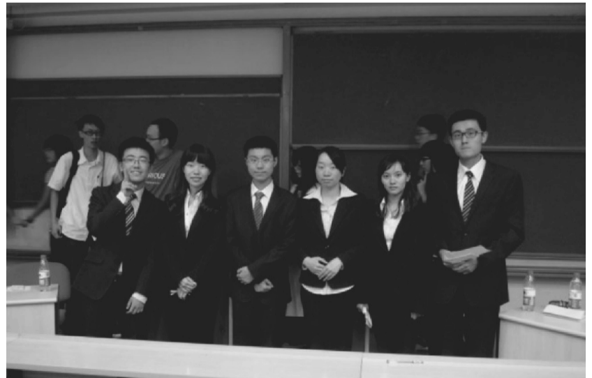
图为辩论赛结束后，两院辩手在明法0301教室合影留念