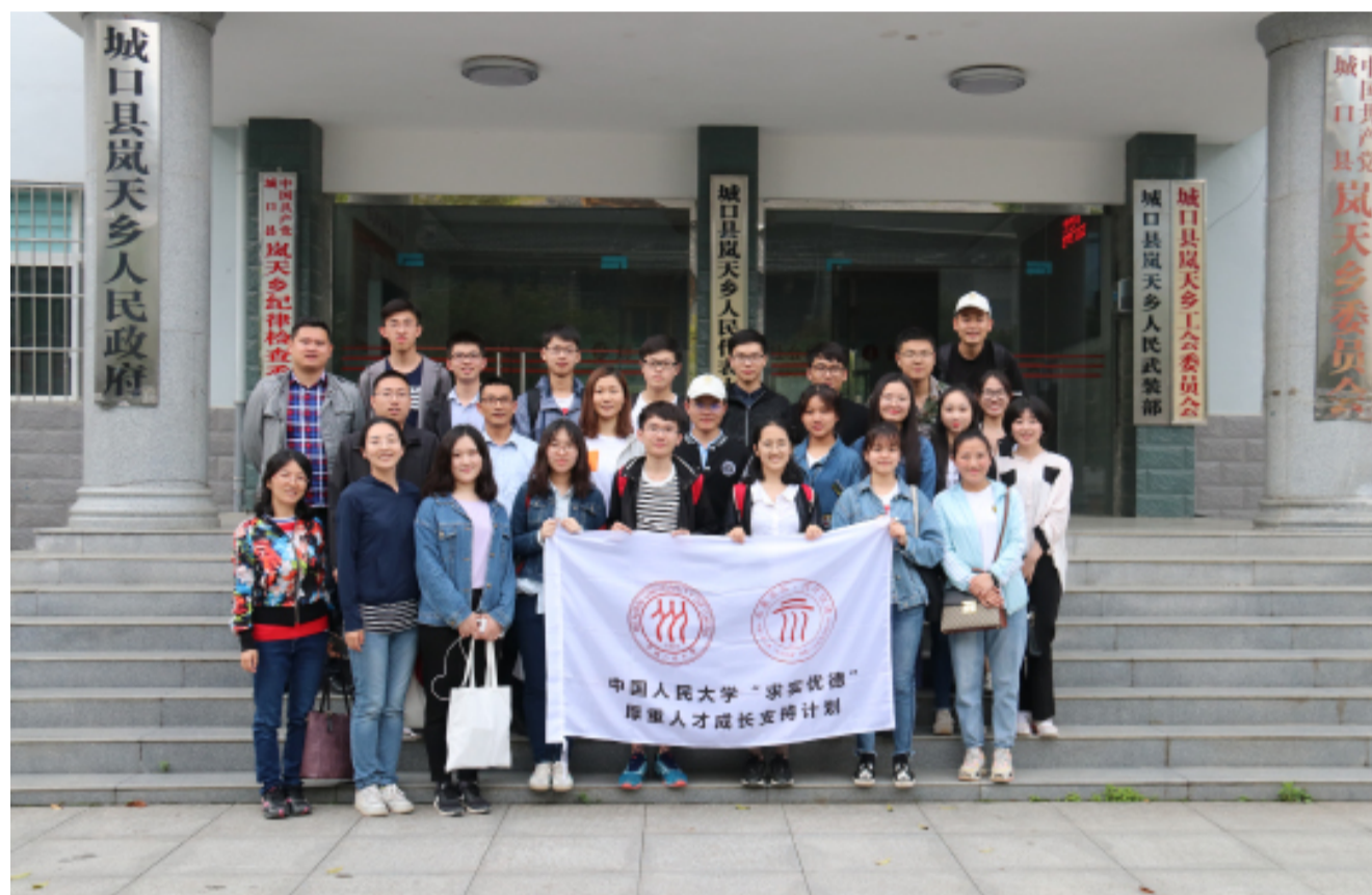
"求实优德"计划成员在重庆城口县调研合影

2018年5月31日 星期四 本期8版 总第76期 主办：共青团中国人民大学社会与人口学院委员会 团宣准字：09-0205号 指导老师：唐颖 庄溪瑞 监制：李爽 邹子晗 主编：熊英宏 郭光泽 本期执编：杨楠